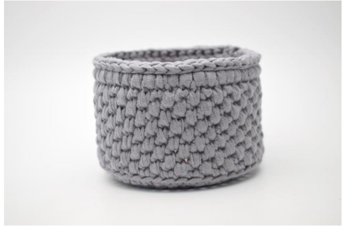
4. Klip garnet og hæft ender.