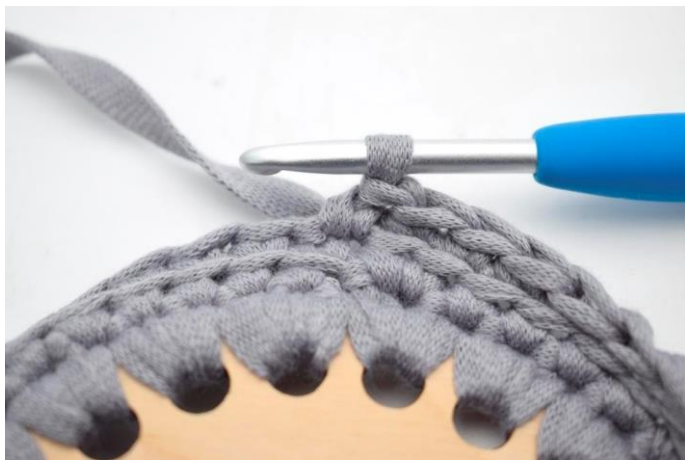
1. "Hækl 1 fm i første m.