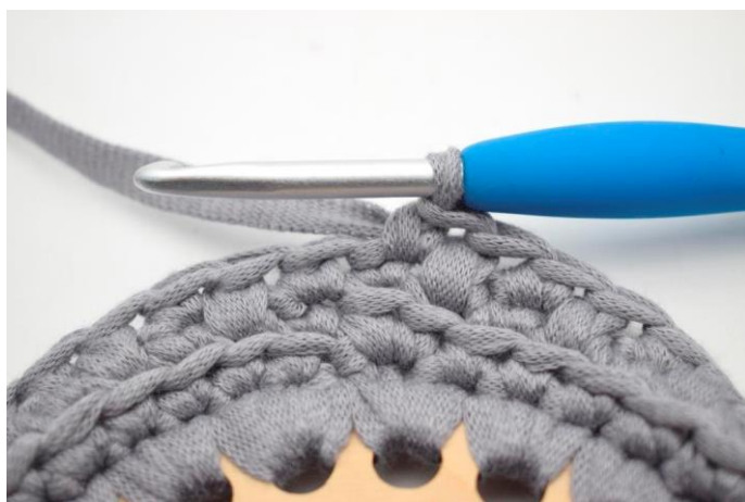
7. Hækl 1 fm i sidste m.