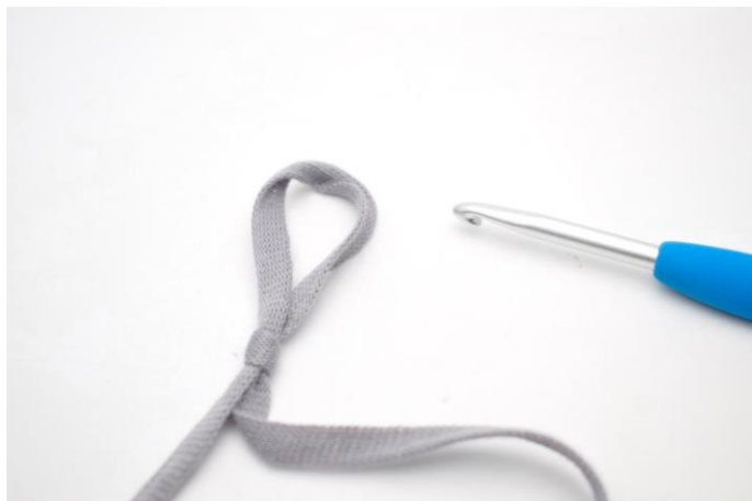
1. Lav en løkke.