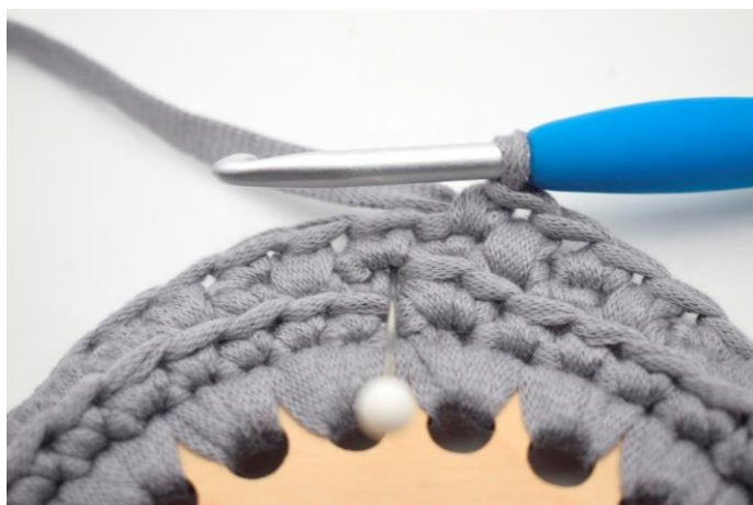
1. ”Hækl 1 dfm i første m.