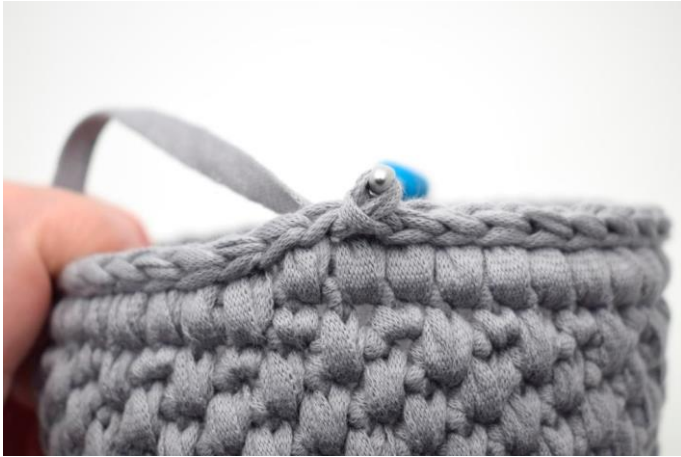
3. Hækl 1 omgang km omgangen rundt.