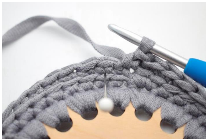
2. Hækl 1 dfm i næste m". En dfm er en alm fastmaske, men som hæklés i masken under så den bliver dyb. Nålen her viser hvor din dfm skal hæklés.