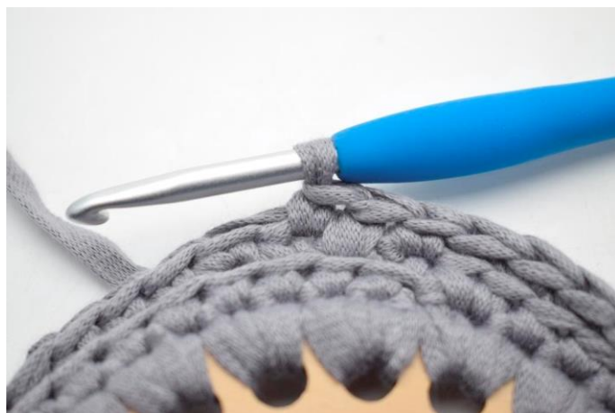
4. "Hækl 1 fm i næste m.