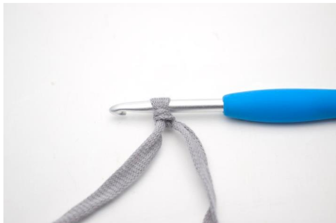
2. Sæt løkken på nålen.