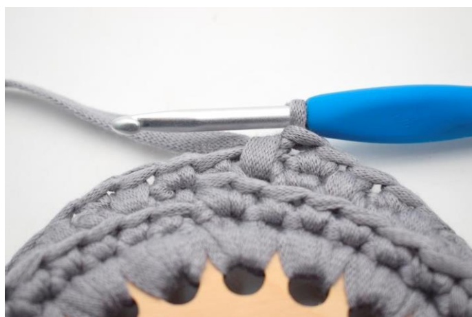
6. Gentag ”til” omgang rundt til du har 1 m tilbage.