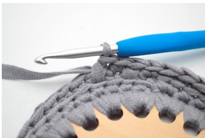
5. Hækl 1 dfm i næste m.”