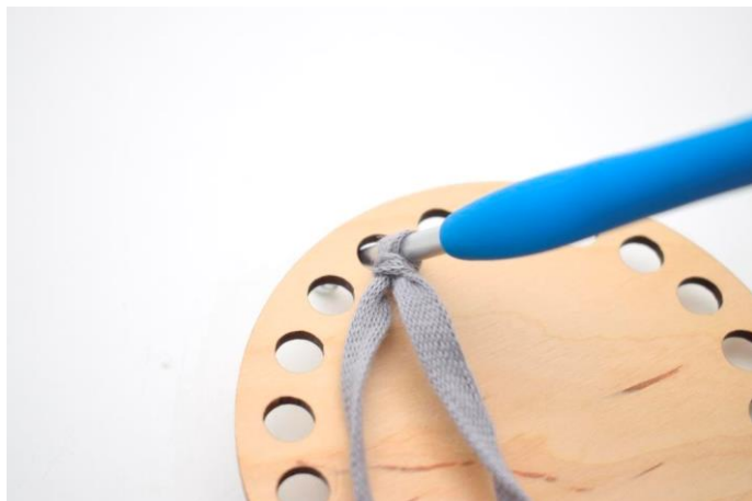
3. Indsæt nålen i en af hullerne i bunden.