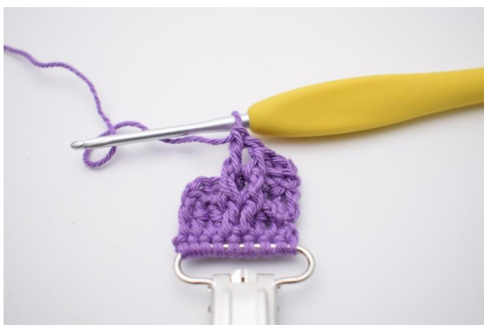
20. Hækl 2 frstgm.