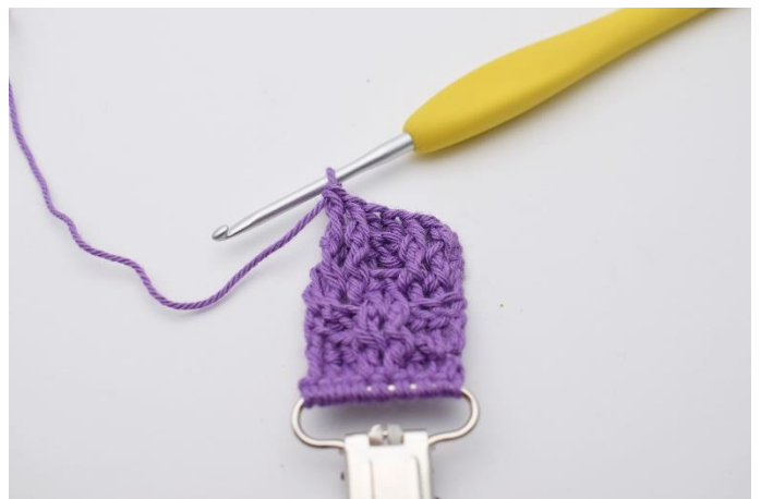
31. Hækl 2 frstgm.