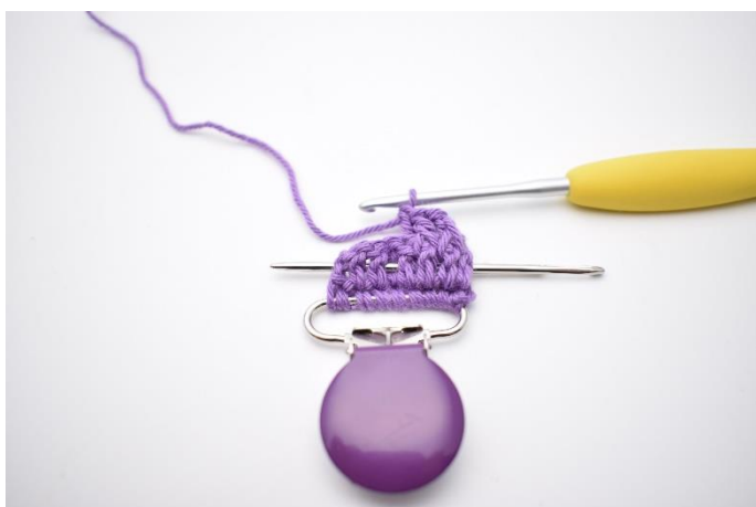
11. Hækl 1 brstgm. Nålen her markerer hvordan hæklenålen skal ned om stgm bagfra.