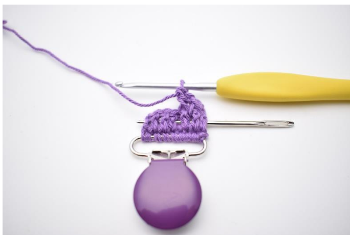
9. Hækl 1 brstgm. Nålen her markerer hvordan hæklenålen skal ned om stgm bagfra.