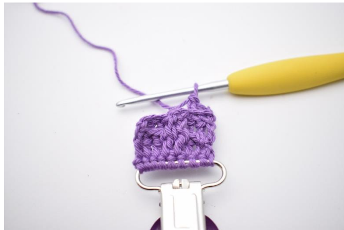
19. Hækl 2 brstgm.