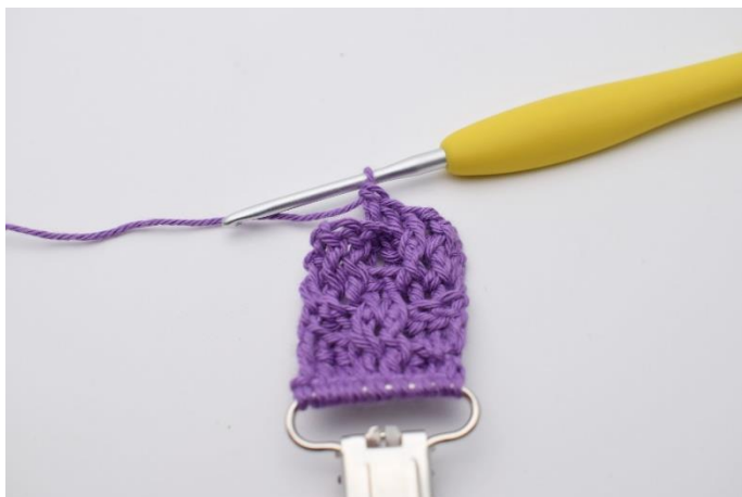
30. Hækl 2 brstgm.