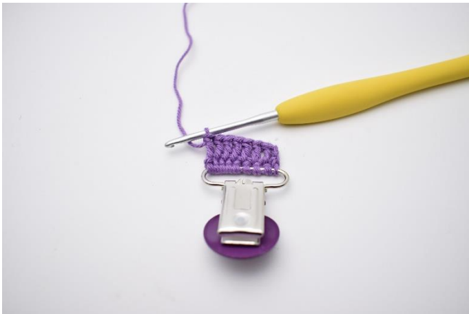
3. Hækl stgm i alle masker.