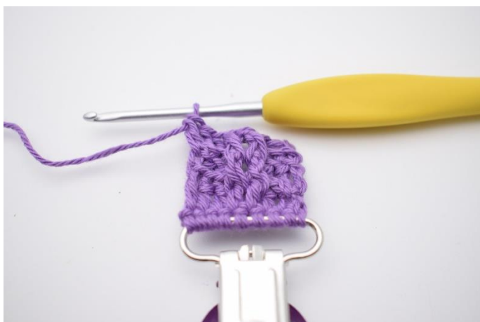
22. I vendemasken hækles 1 alm. stgm.