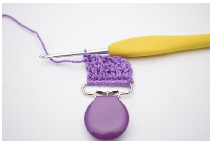
17. Hækl 1 alm. stgm i vendemasken.