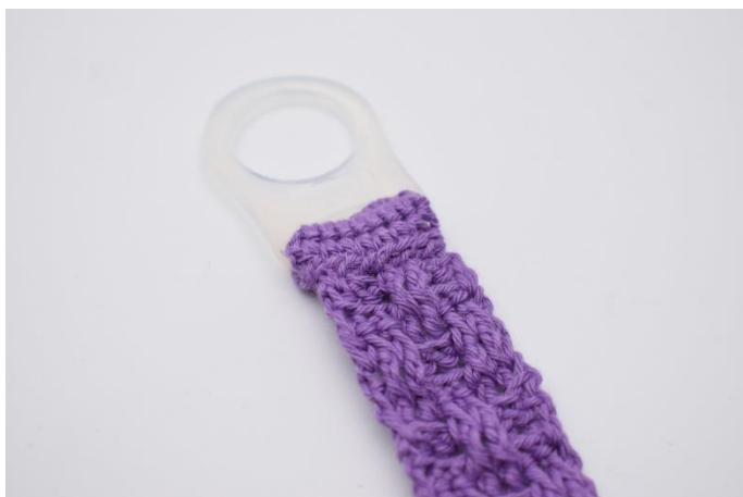
3. Fold stykket omkring adapteren og sy det fast.