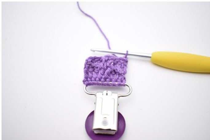
18. Vend dit arbejde med 2 lm.