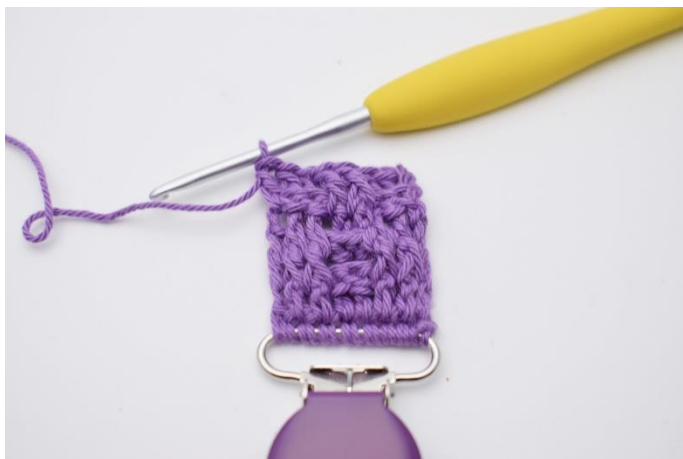
27. Hækl 1 alm. stgm i vendemasken.