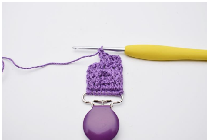
25. Hækl 2 frstgm.