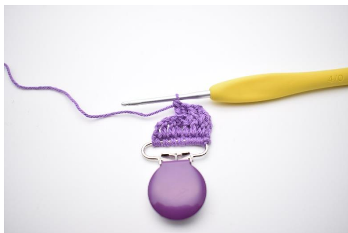
12. Sådan. Der er nu hæklet 2 brstgm