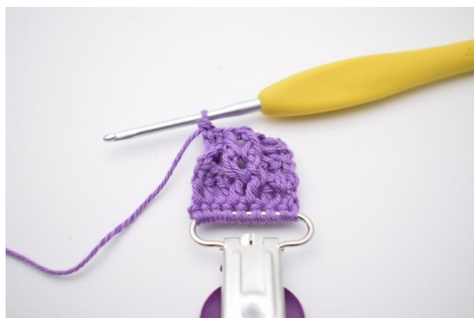
21. Hækl 2 brstgm.