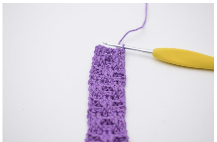
33. Gentag nu række 3-6 som beskrevet i opskriften