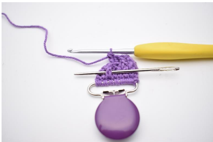
13. Hækl 1 frstgm omkring næste m. Nålen markerer igen hvordan hæklenålen skal ned om stgm stolpen forfra.