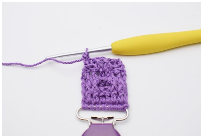
26. Hækl 2 brstgm.