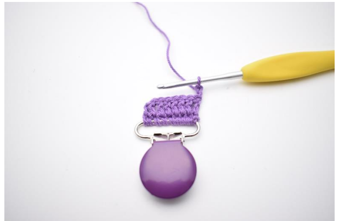
4. Vend med 2 lm.