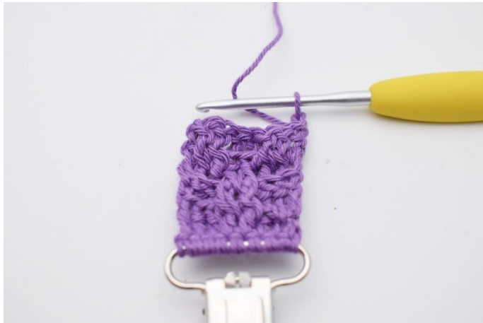
28. Vend dit arbejde med 2 lm.