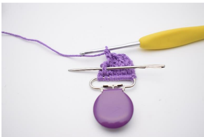
15. Hækl 1 frstgm omkring næste m. Nålen markerer igen hvordan hæklenålen skal ned om stgm stolpen forfra.