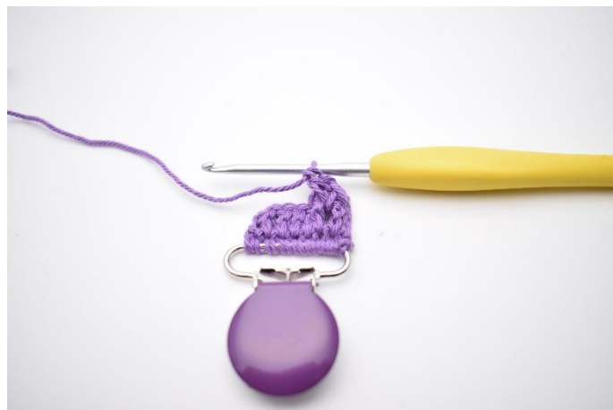
8. Sådan. Der er nu hæklet 2 frstgm.