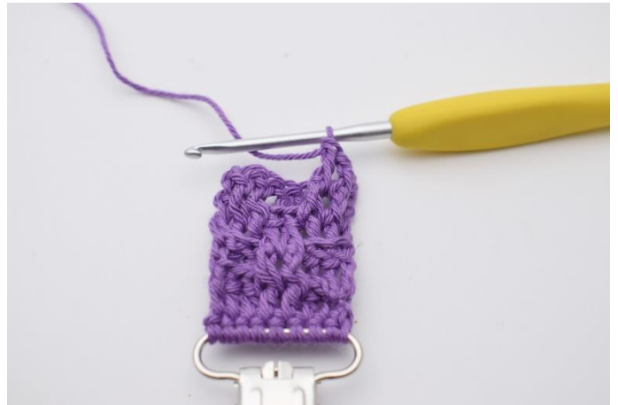
29. Hækl 2 frstgm.