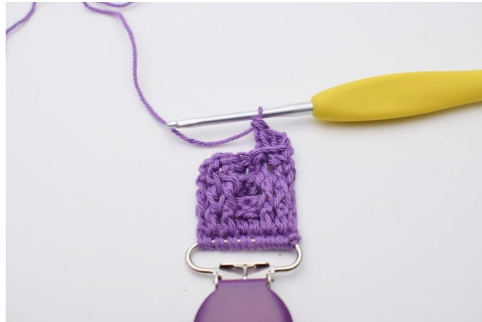
24. Hækl 2 brstgm.