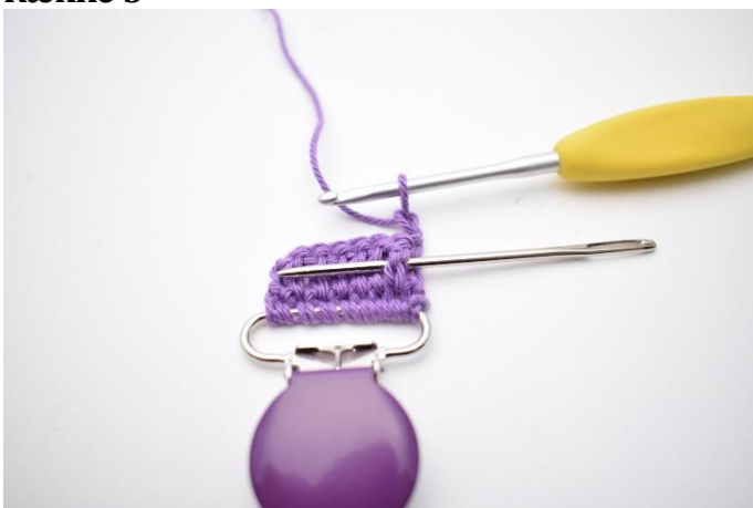
5. Hækl 1 frstgm. Nålen her markerer hvordan hæklenålen skal ned om stgm stolpen forfra på 2. stgm på forrige række.