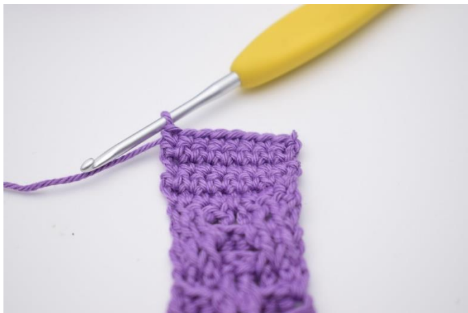
1. Hækl 5 rækker med fm til montering af sutte adapteren.