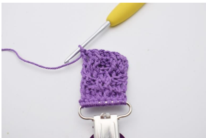
32. Hækl 1 alm. stgm i vendemasken.