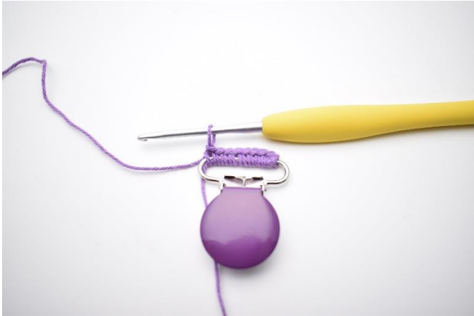
1. Start med at slå dine masker op på clipsen.