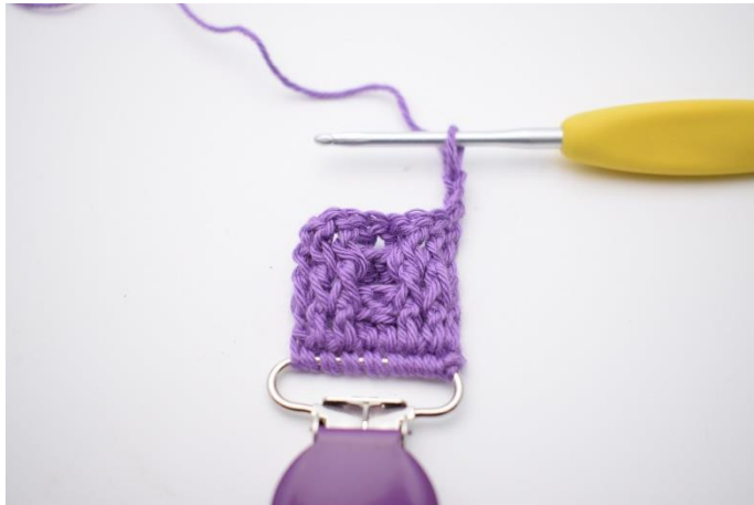
23. Vend dit arbejde med 2 lm.