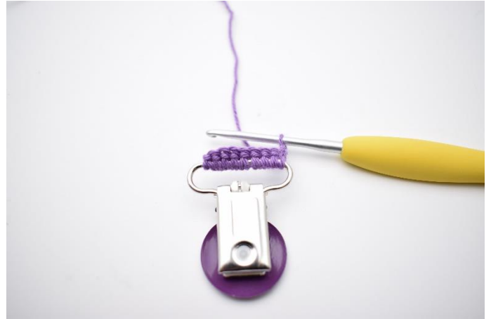
2. Vend med 2 lm.