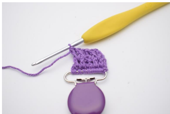
16. Sådan. Der er nu hækket 2 frstgm.