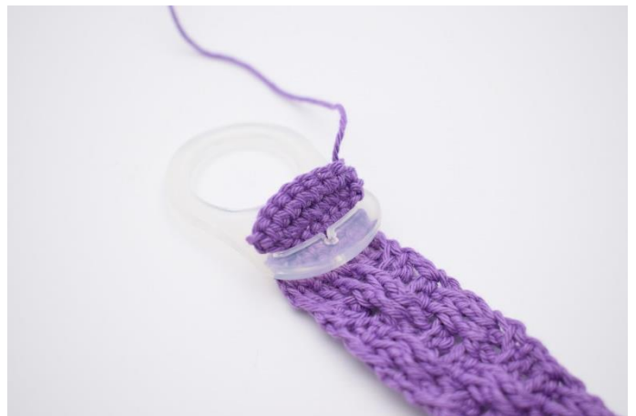
2. I revnen på adapteren indsattes fm stykket.