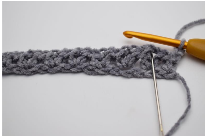
8. Vend arbejdet med 2 lm. Nu hækles der "1 hstm, 1 lm, 1 hstm" i alle lm-mellemrum på forrige række.