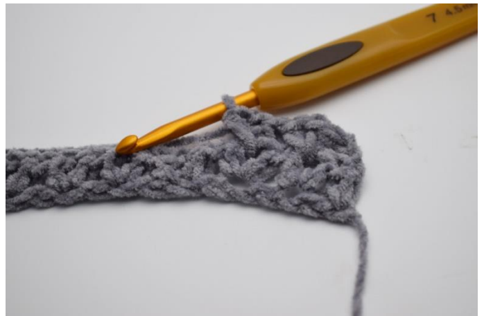
10. Gentag i næste lm- mellemrum "1hstm, 1 lm, 1 hstm".