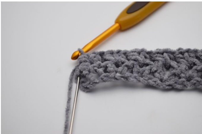
11. Gentag rækken ud. I sidste maske hækles 1 hstm.