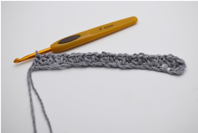
7. Der er nu hæklet første række.