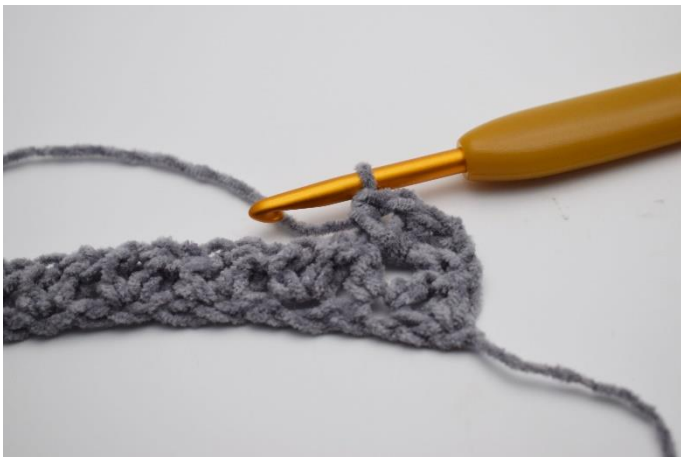
9. Hækl "1hstm, 1 lm, 1 hstm" i første lm-mellemrum.