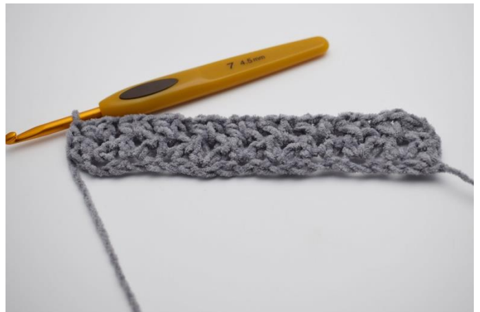
12. Denne række gentages til du har det ønskede mål eller i alt 112 rækker.