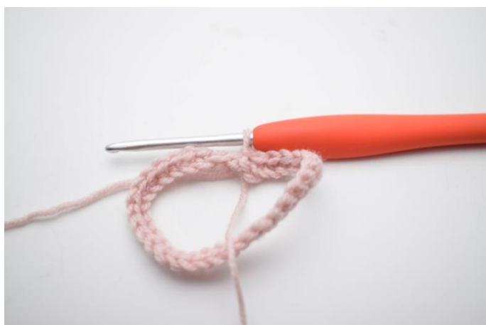
4. Afslut med 1 km i første fm. (30 (32) 34 (36))