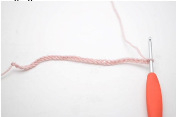
1. Slå 30 (32) 34 (36) lm op.