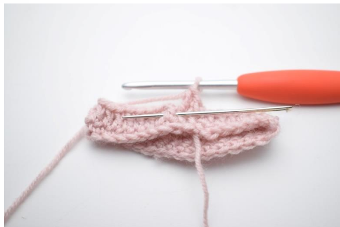
6. Hækl 1 frstgm omkring næste m.