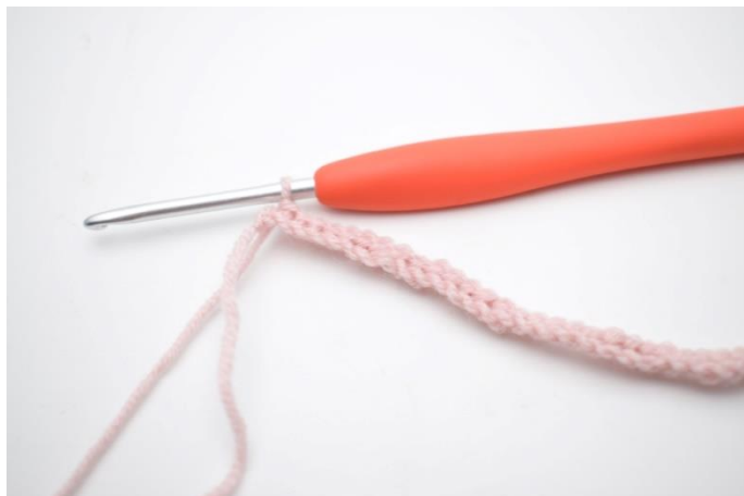
3. Hækl km rækken ud.