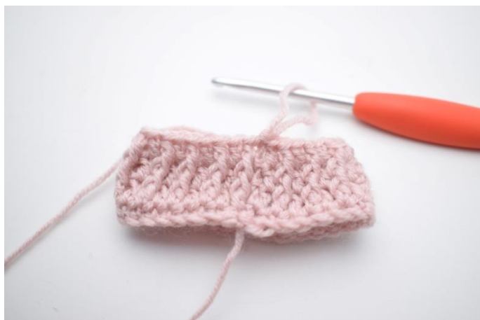
6. Gentag "til" omgangen rundt. Afslut med 1 km i første frstgm. (30 (32) 34 (36))