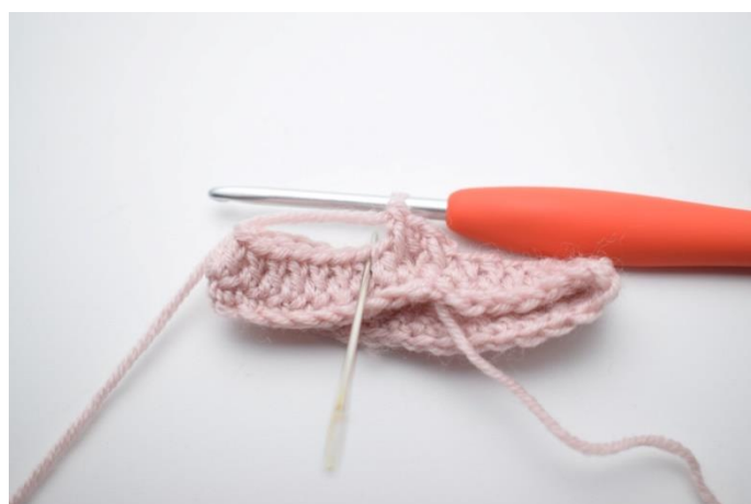
8. Hækl 1 stgm i næste m.