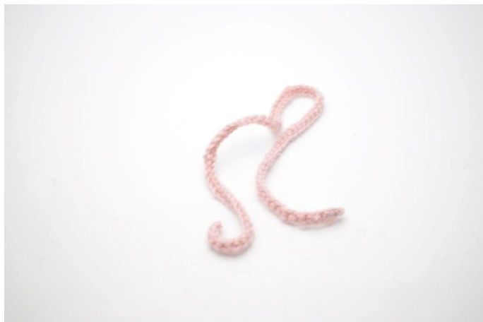
4. Klip garnet og hæft ender.