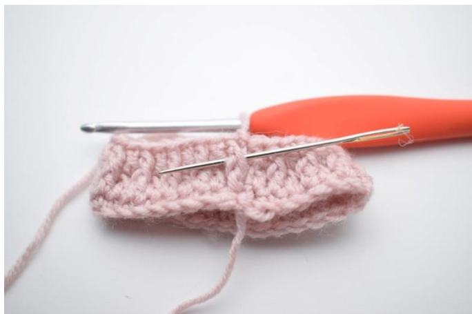
2. Hækl 1 frstgm omkring første m.