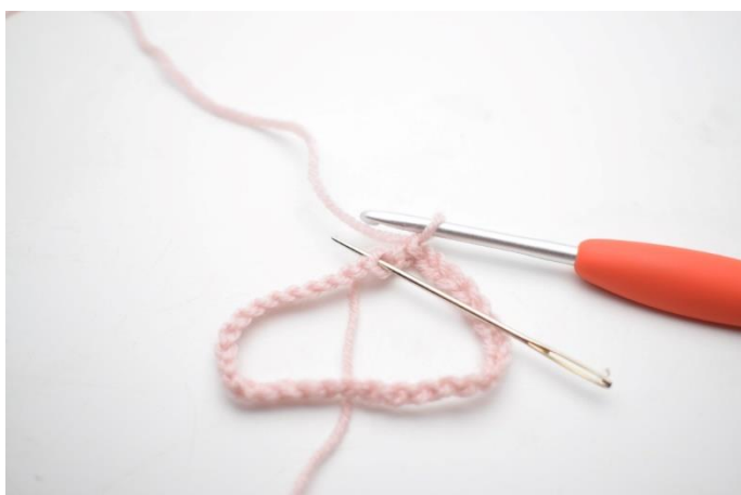
3. Lav 1 lm. Vend din lm række, og hæk 1 fm i den vandrette lænke omgangen rundt.