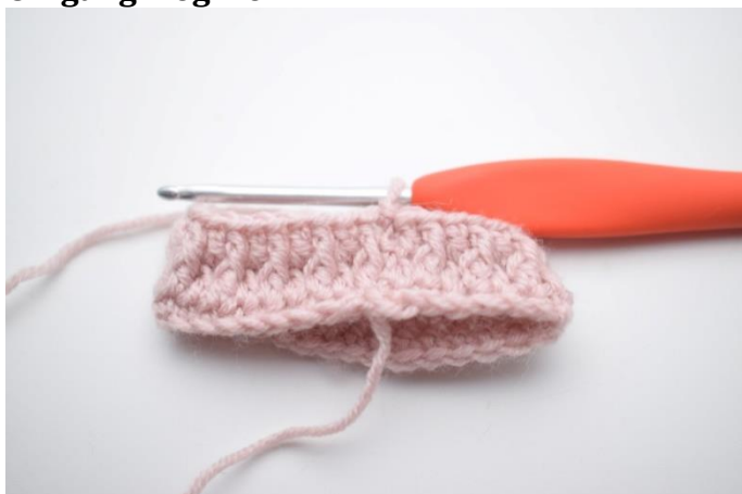
1. Hækles som omgang 3. Lav 1 lm.