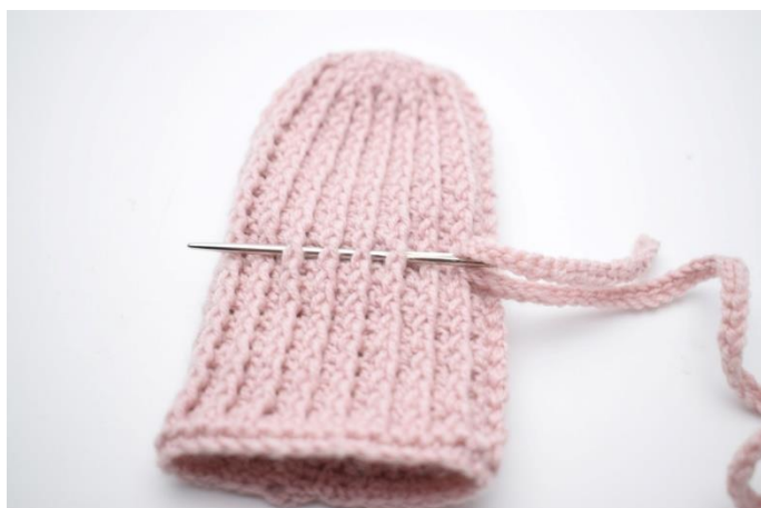
5. Indsæt bindebånd under forhøjningerne i omgang 8 (9) 10 (11) hele vejen rundt.