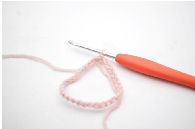
2. Samt til en ring med 1 km.