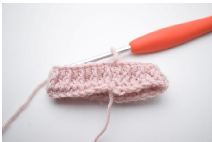
10. Hækl "1 frstgm omkring første m. Hækl 1 alm. stgm i næste m". Gentag "til" omgangen rundt. Afslut med 1 km i første frstgm. (30 (32) 34 (36))