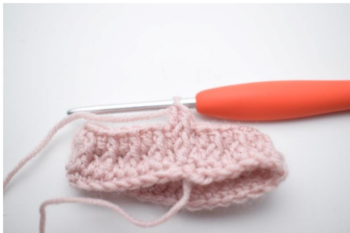
4. Hækl 1 stgm i næste m.