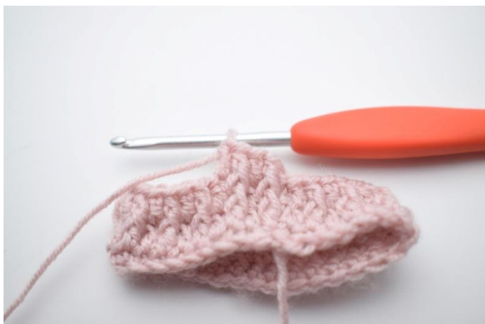
5. Hækl "1 frstgm omkring første m. Hækl 1 alm. stgm i næste m".