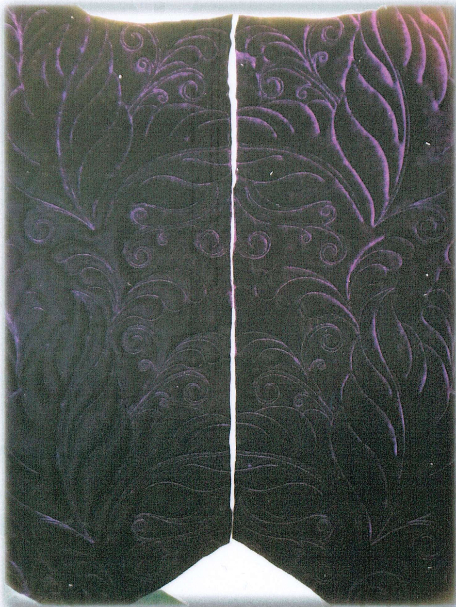
De to forstykker med perfekt spejlvent quilting.