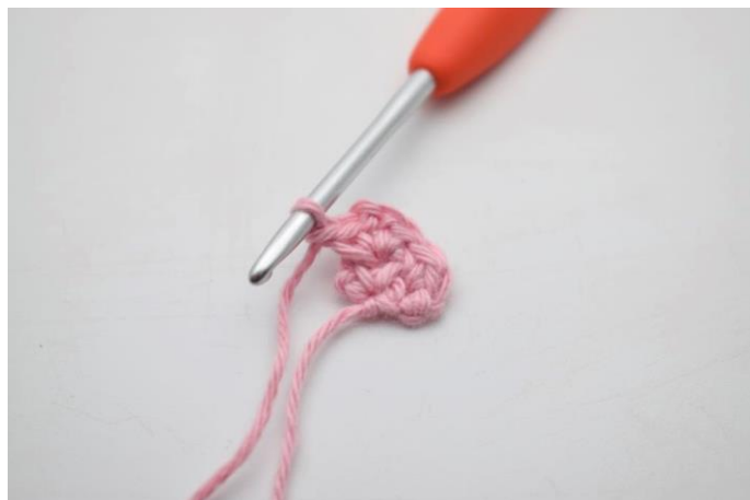
7. Lav 1 lm.