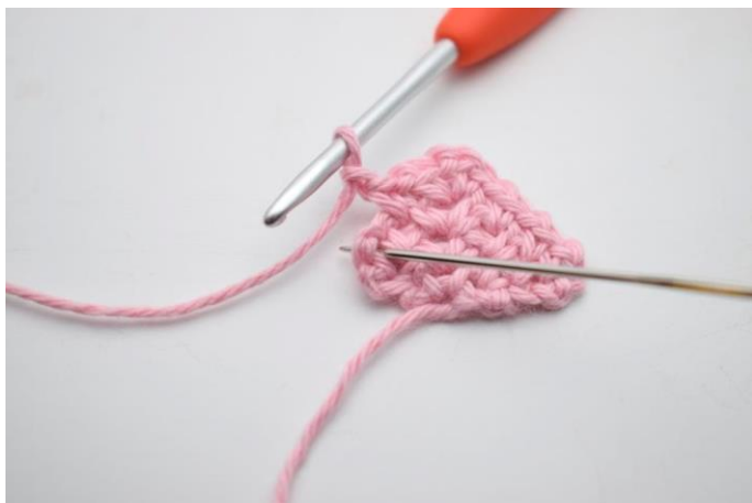
17. Hækl 1 fm i næste lm-mellemrum fra forrige række.