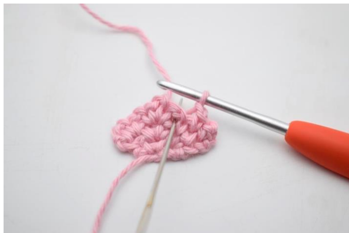
8. Hækl 1 fm i næste lm-mellemrum fra forrige række.