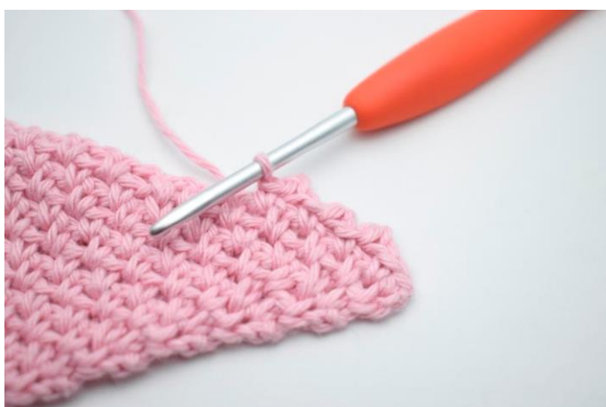
13. "Lav 2 lm, hækl 1 km i 2. lm fra nålen, spring 1 m over og hækl 1 fm i næste lm-mellemrum".