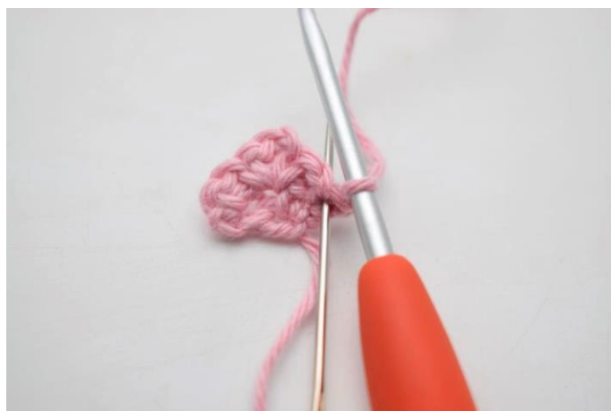
2. Hækl 1 fm i første m.