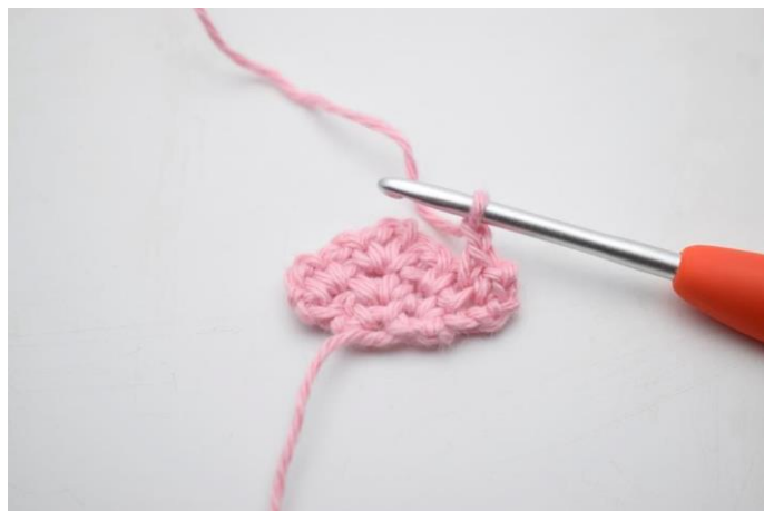
7. Lav 1 lm.