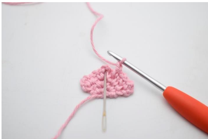
11. I lm-buen fra forrige række hækles 1 fm, 2 lm og 1 fm.