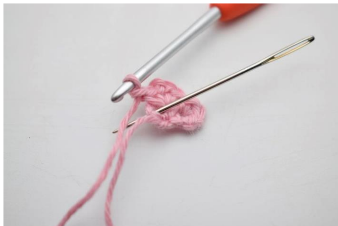
8. Hækl 1 fm i sidste m.