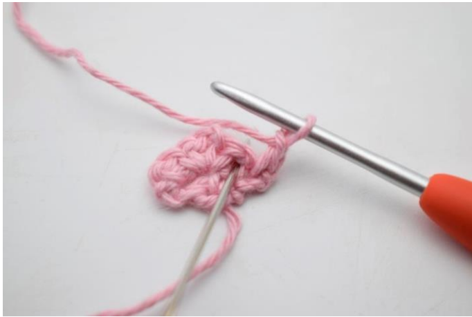
5. Hækl 1 fm i lm-mellemrum fra forrige række.