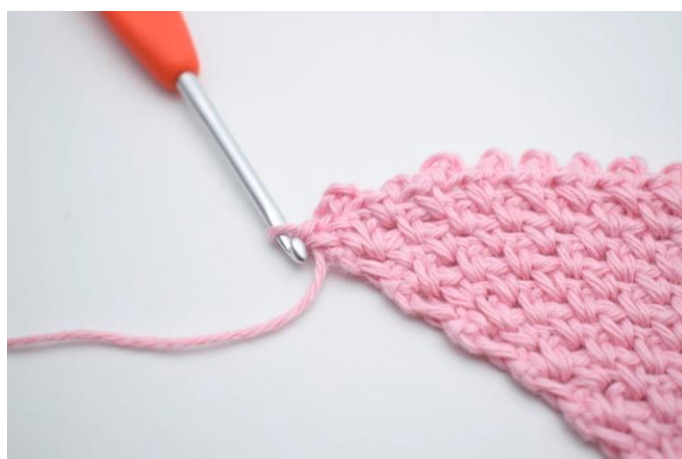
14. Gentag "til" omgangen rundt. Afslut med 1 fm i sidste m.