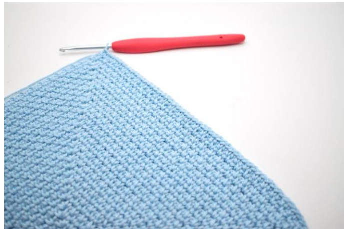
2. Hækl fm i alle m og lm-mellemrum frem til spidsen.