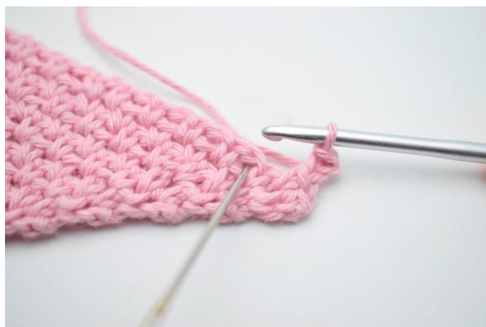
6. Spring 1 m over og hækl 1 fm i næste mellemrum".