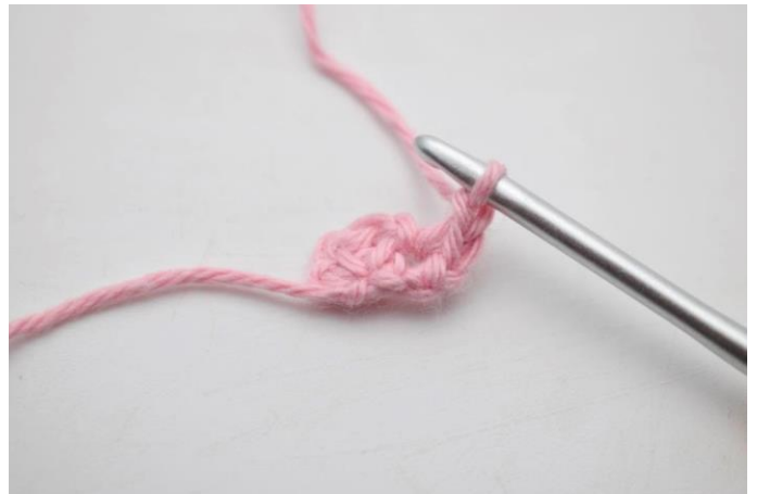
4. Lav 1 lm.