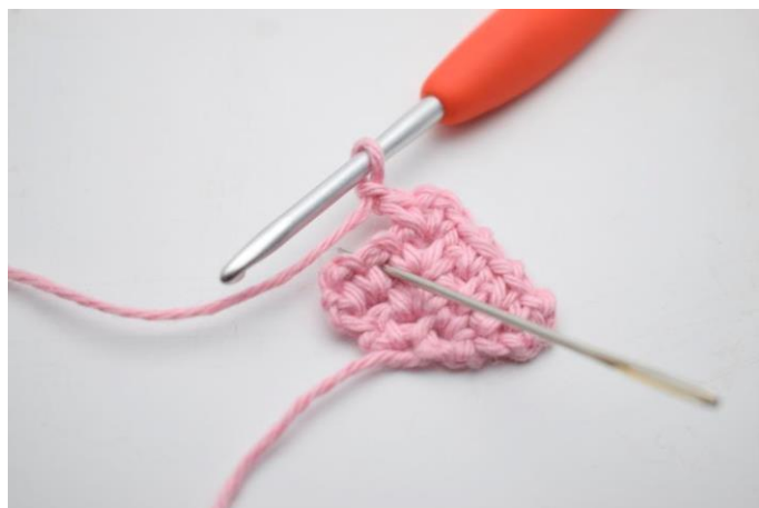
14. Hækl 1 fm i lm-mellemrum fra forrige række.