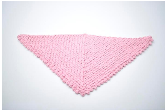
16. Klip garnet og hæft ender.