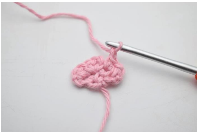
7. Lav 1 lm.