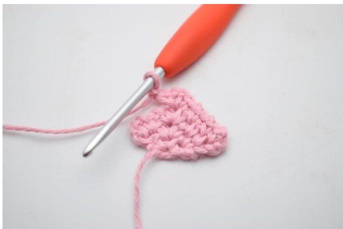
13. Lav 1 lm.