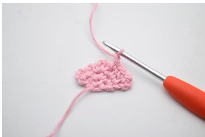
10. Lav 1 lm.