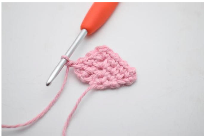
19. Lav 1 lm.