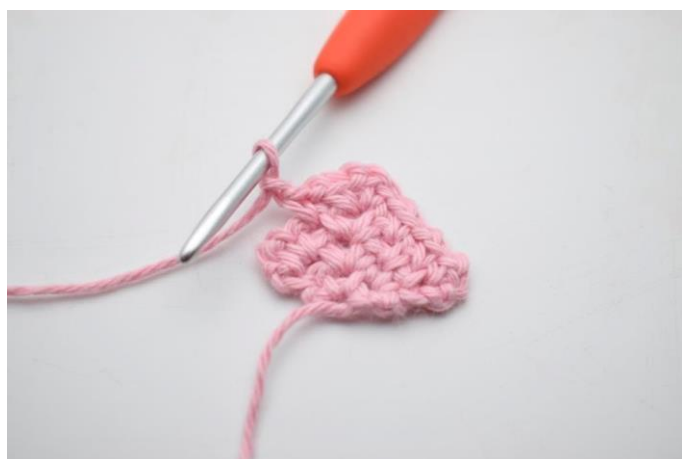
16. Lav 1 lm.