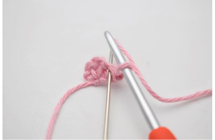
2. Hækl 1 fm i første m.