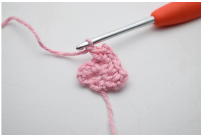
10. Lav 1 lm.