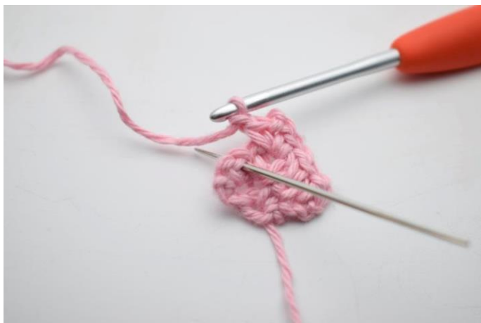
11. Hækl 1 fm i lm-mellemrum fra forrige række.