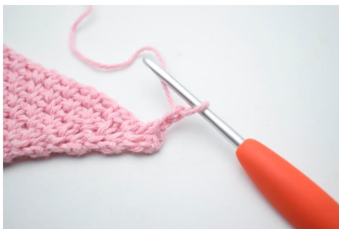
3. "Lav 2 lm.