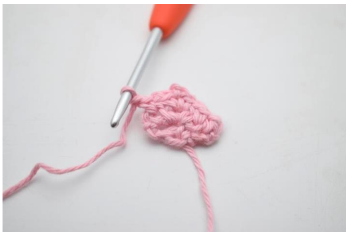
13. Lav 1 lm.