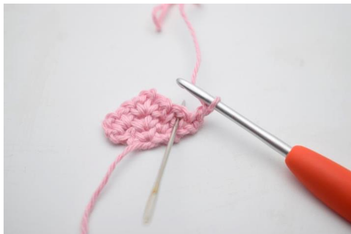
5. Hækl 1 fm i lm-mellemrum fra forrige række.