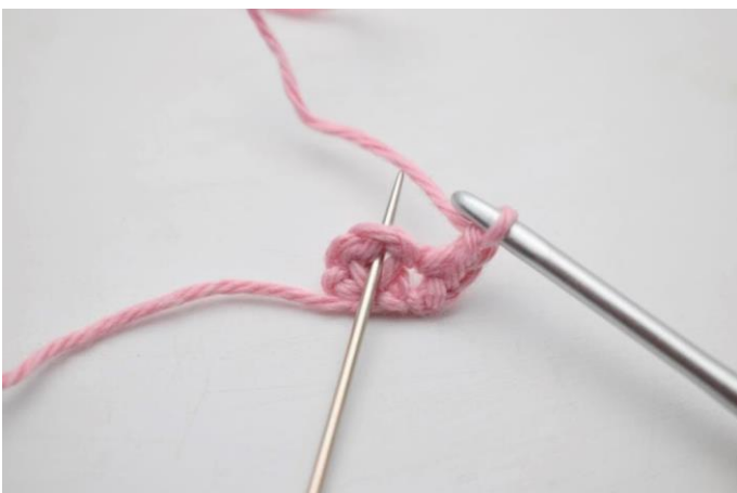
5. I lm-buen fra forrige række hækles 1 fm, 2 lm og 1 fm.