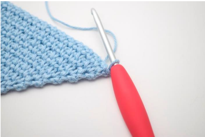
1. Vend med 1 lm.