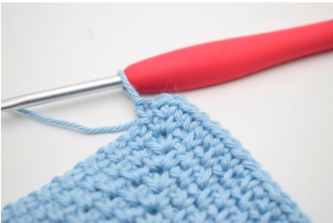
3. I lm-buen i spidsen hækles 2 fm.