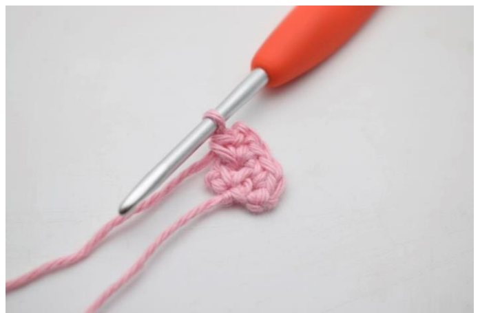
6. Sådan. Dette bliver spidsen af arbejdet.