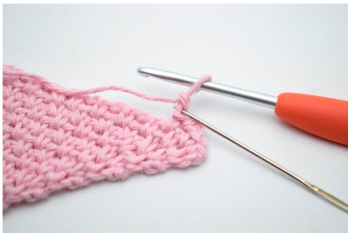
9. Hækl 1 km i 2. lm fra nålen.