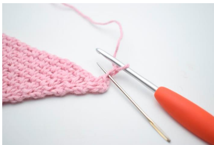
4. Hækl 1 km i 2. lm fra nålen.