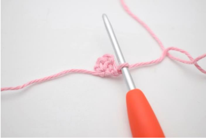
1. Vend med 1 lm.