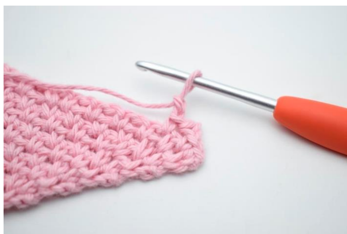
8. "Lav 2 lm.