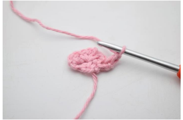
4. Lav 1 lm.