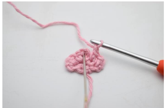
8. I lm-buen fra forrige række hækles 1 fm, 2 lm og 1 fm.