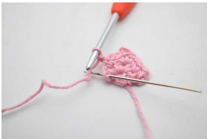
14. Hækl 1 fm i sidste m.