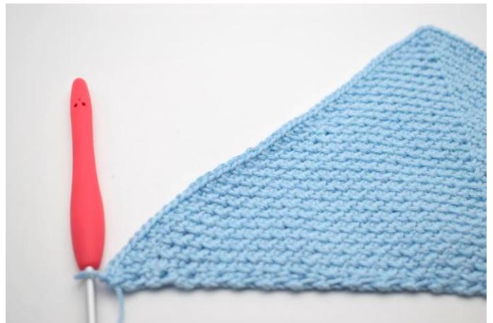
4. Hækl fm i alle m og lm-mellemrum på den anden side også.