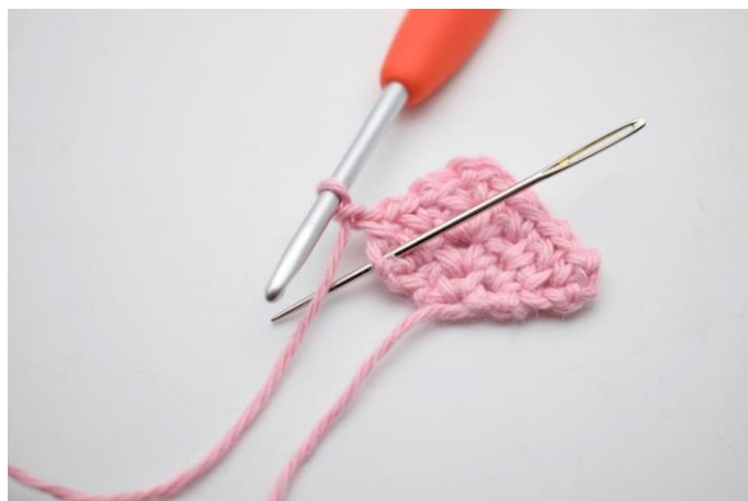
20. Hækl 1 fm i sidste m.