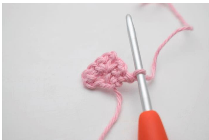
1. Vend med 1 lm.