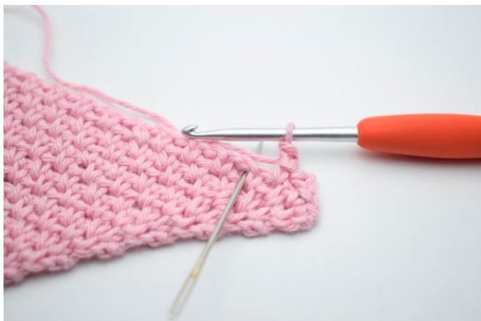
11. Spring 1 m over og hækl 1 fm i næste lm-mellemrum.