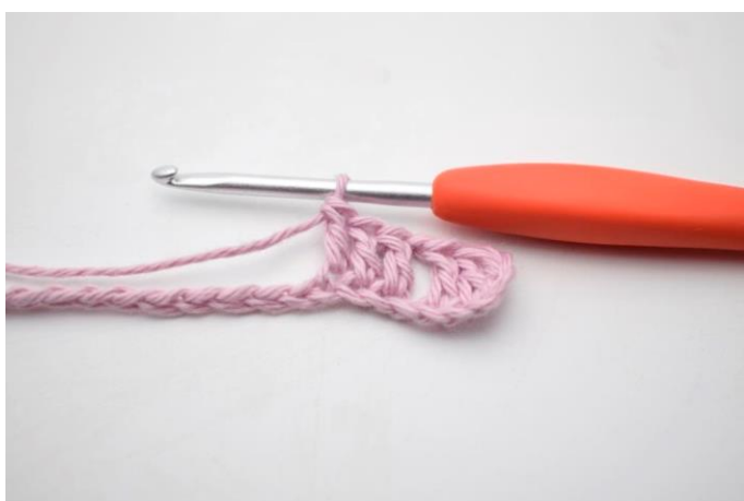
5. "Lav 1 lm, spring 1 lm over og hækl 1 stgm i de næste 3 lm".