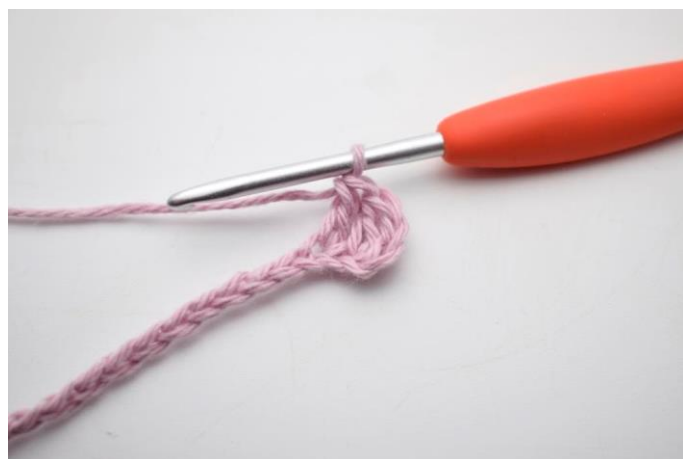
4. Hækl 1 stgm i næste lm.