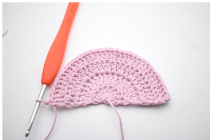
6. Gentag "til" rækken ud. (36)