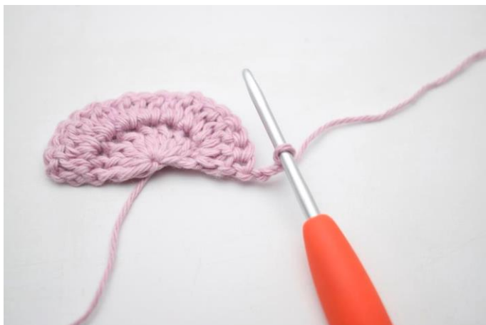
1. Vend med 3 lm.