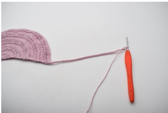
1. Vend og lav 35 lm.