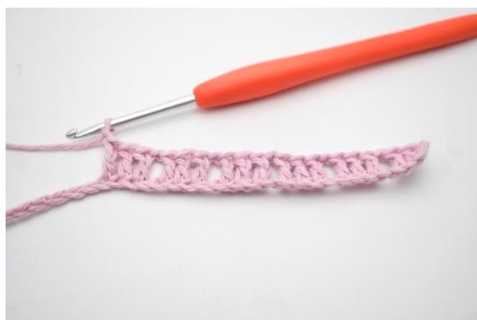
6. Gentag "til" i alt 5 gange.