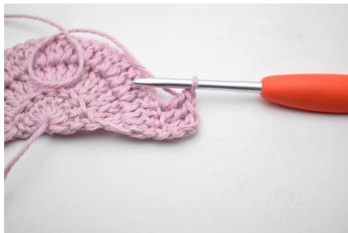
4. Hækl 1 stgm i de næste 2 m.