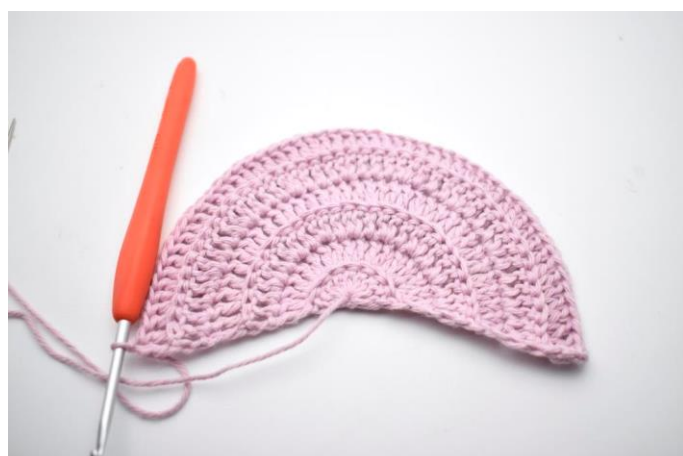
1. Denne række hækles i bml. Vend med 3 lm. Hækl 1 stgm i samme m. Hækl 1 stgm i de næste 4 m. "Hækl 2 stgm i næste m, 1 stgm i de efterfølgende 4 m". Gentag "til" rækken ud. (54)