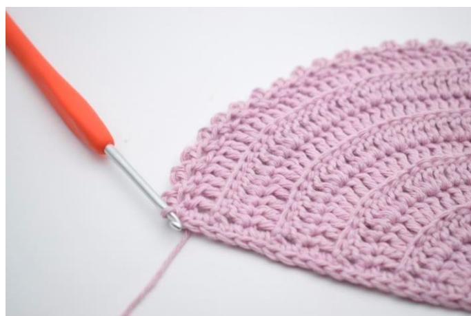
14. "Lav 2 lm, hækl 1 km i 2. lm fra nålen, spring 1 m over og hækl 1 fm i næste m". Gentag "til" omgangen ud og afslut med 1 km i første m.