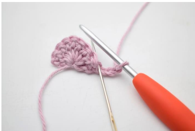
1. Denne række hækles i bml. Vend med 3 lm. Hækl 1 stgm i samme m.