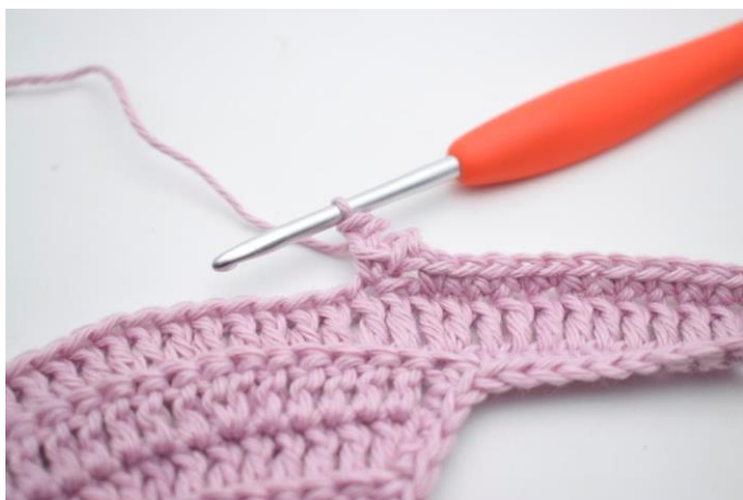
11. Spring 1 m over.