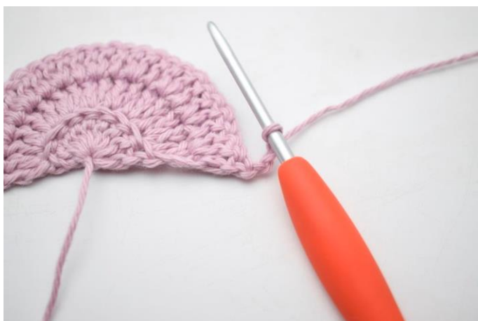
1. Denne række hækles i bml. Vend med 3 lm.