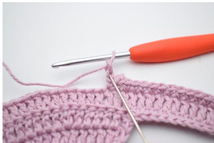
10. Hækl 1 km i 2. lm fra nålen.