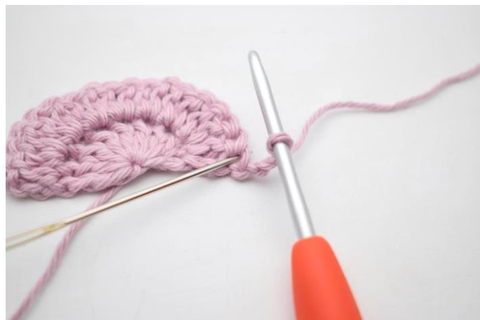
2. Hækl 1 stgm i samme m.