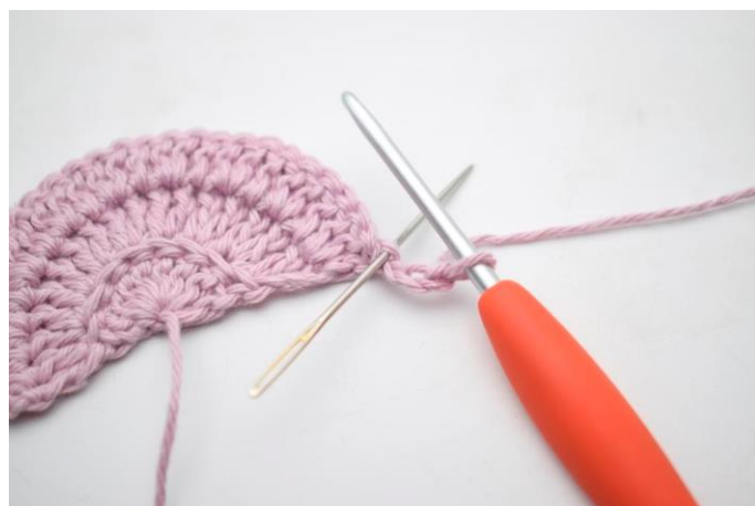
2. Hækl 1 stgm i samme m.