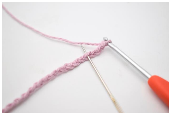
2. Hækl 1 stgm i 4. lm fra nålen.