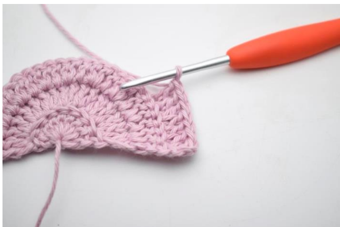
5. "Hækl 2 stgm i næste m, 1 stgm i de efterfølgende 2 m".