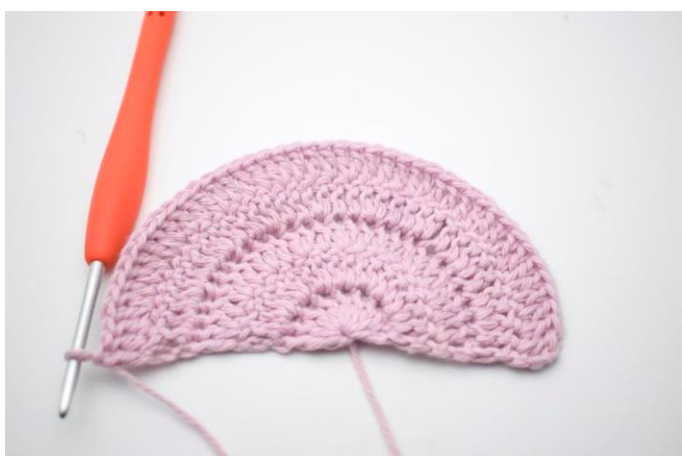
1. Vend med 3 lm. Hækl 1 stgm i samme m. Hækl 1 stgm i de næste 3 m. "Hækl 2 stgm i næste m, 1 stgm i de efterfølgende 3 m". Gentag "til" rækken ud. (45)