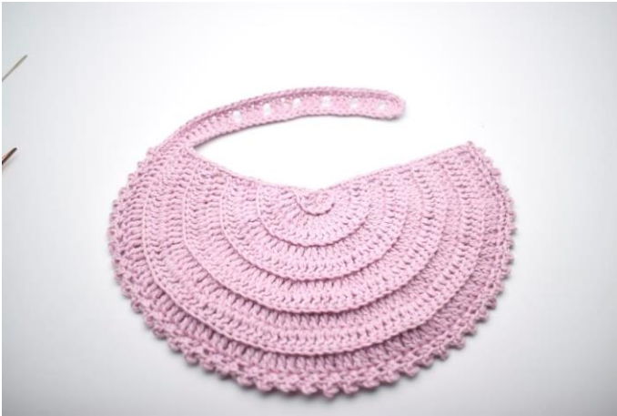
15. Sådan. Klip garnet og hæft ender.