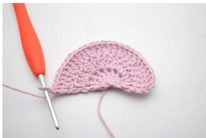
6. Gentag "til" rækken ud. (27)