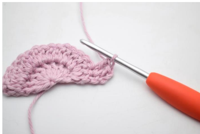
4. Hækl 1 stgm i næste m.