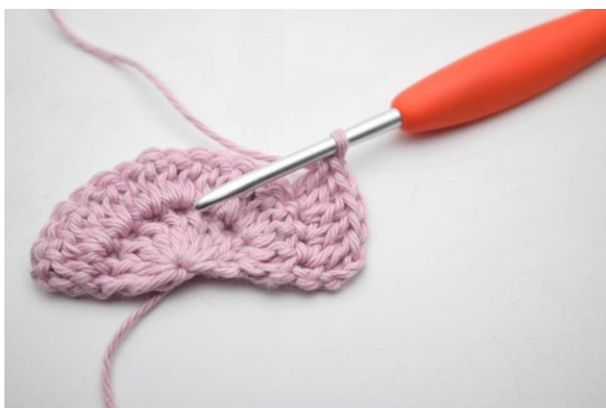
5. "Hækl 2 stgm i næste m, 1 stgm i den efterfølgende m".