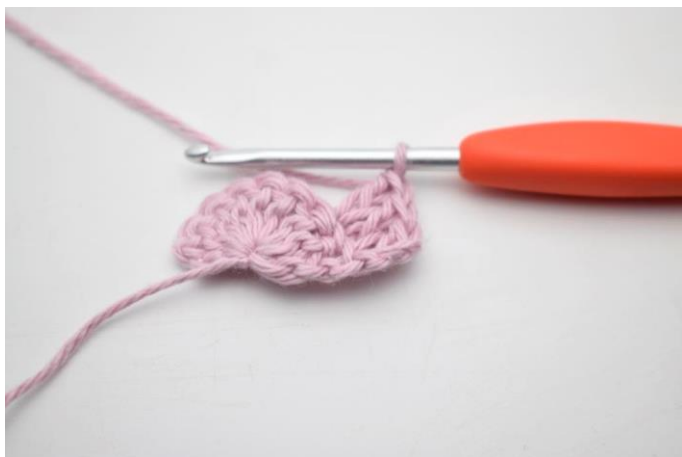
3. Hækl 2 stgm i næste m.