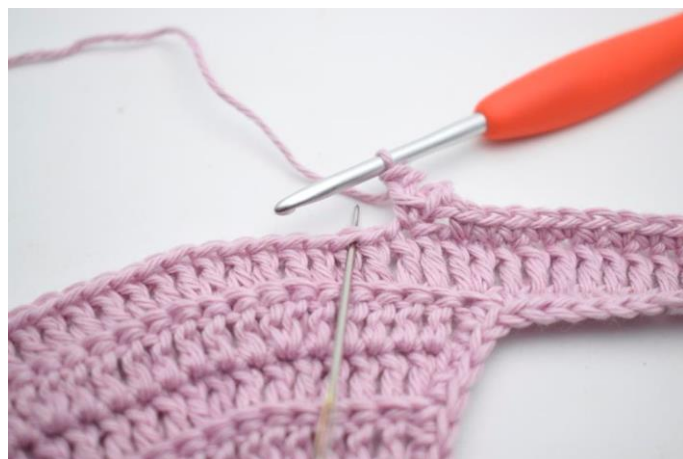
12. Hækl 1 fm i næste m.